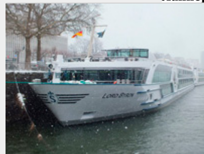
Lord Byron 5*