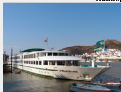
Belle De Cadix